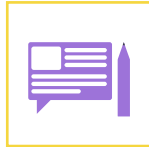
ETUDE DE CAS